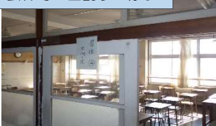
訓練時の区割りの様子