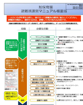
マニュアルの概要版