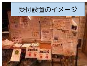
受付設置のイメージ