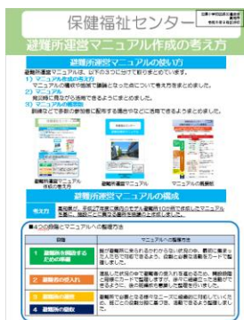
避難所運営マニュアル 作成の考え方