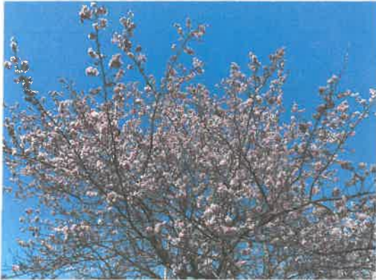
鏡湖公園の近くの桜が咲いていました(2/17撮影)。