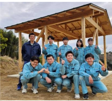
久重 youth の公園づくり

この制度の効果や仮に導入するとした場合の課題などはこれから検討していくこととなります。導入前提ではありませんが、久重型共生社会推進の立場に立った検討を進めていきます。