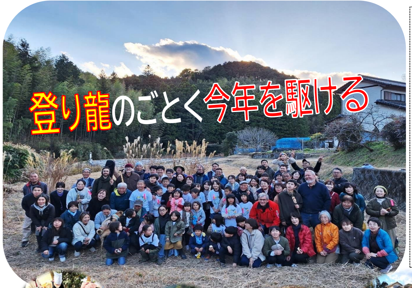
里山の春を呼ぶ七草フェスタ 久重の新しい年は「春の七草フェスタ」から。背景の雲が西日を受け登り龍みたい(こいつは春から縁起がいい) 11月7日、撮影:今久保美和さん提供