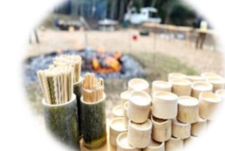
竹で作った箸とお椀(お持ち帰りOK)