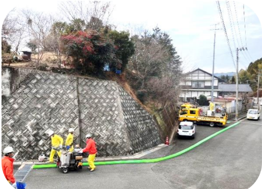
久重保育園前から小学校へ伸びるあざやかな緑のライン=1月17日