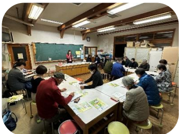
市の担当者を招き有償ボランティアについて学習をした第63回役員会=1月17日