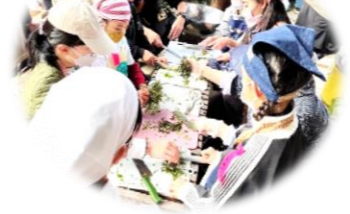
採取した春の七草を子どもたちが刻む