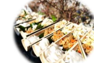
孟宗竹に入ったお漬物