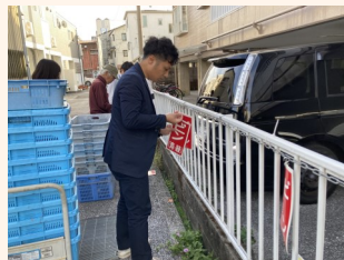
ステーションの準備