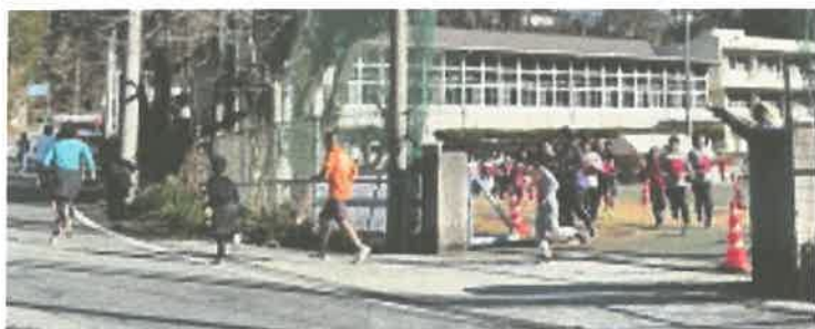
↑カラフルなウェアのランナーさんたちのスタート