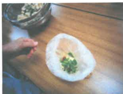
↑アイラップへ野草などを入れて、パッキングします。