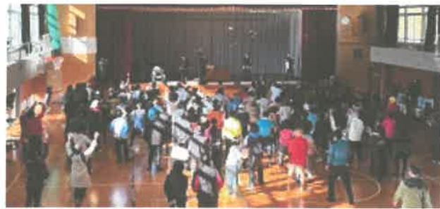
↑体育館で餅まき。ハート形のお餅もありました。