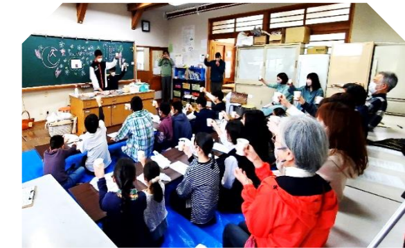
4月29日の「久重 youth 発足会」に集まったわかものや地域の人たちでカンパイ！

避難所開設訓練では中高生を見習って小学6年生が運営責任者になり、住民の皆さんを誘導しました。