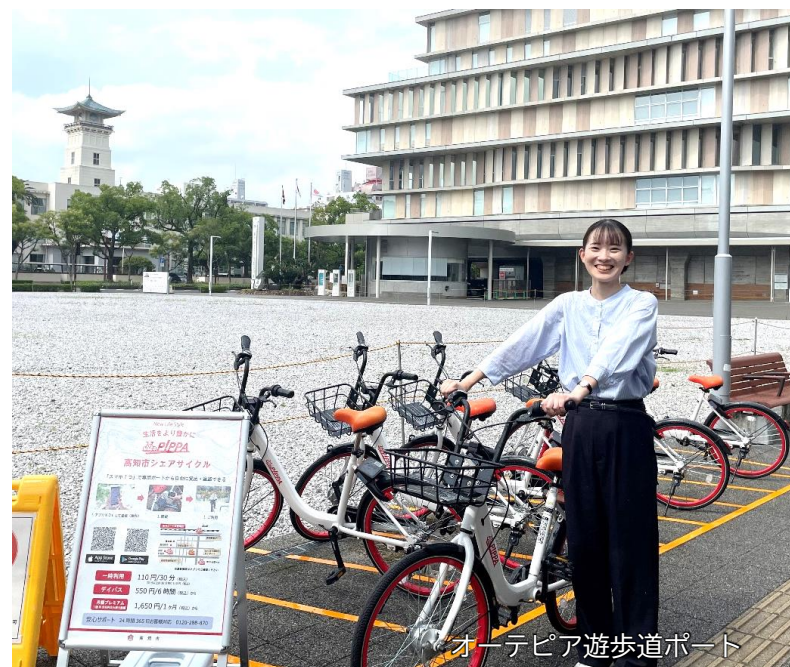
オーテピア遊歩道ポート