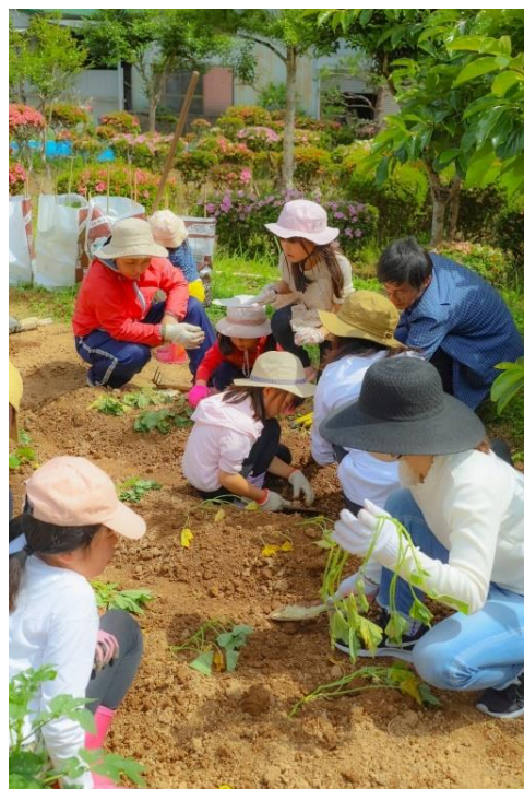
お芋のツルを植えたよ!

布師田の未来を考える会は「布師田がこんなになったらいいね!」「こんなことやりたいけど、どうやったらできるろう?」など、地域がよくなるよう、夢やアイデアを出し合い場ですので、お気軽にご参加ください。定例会は奇数月第3木曜日午後7時からです。